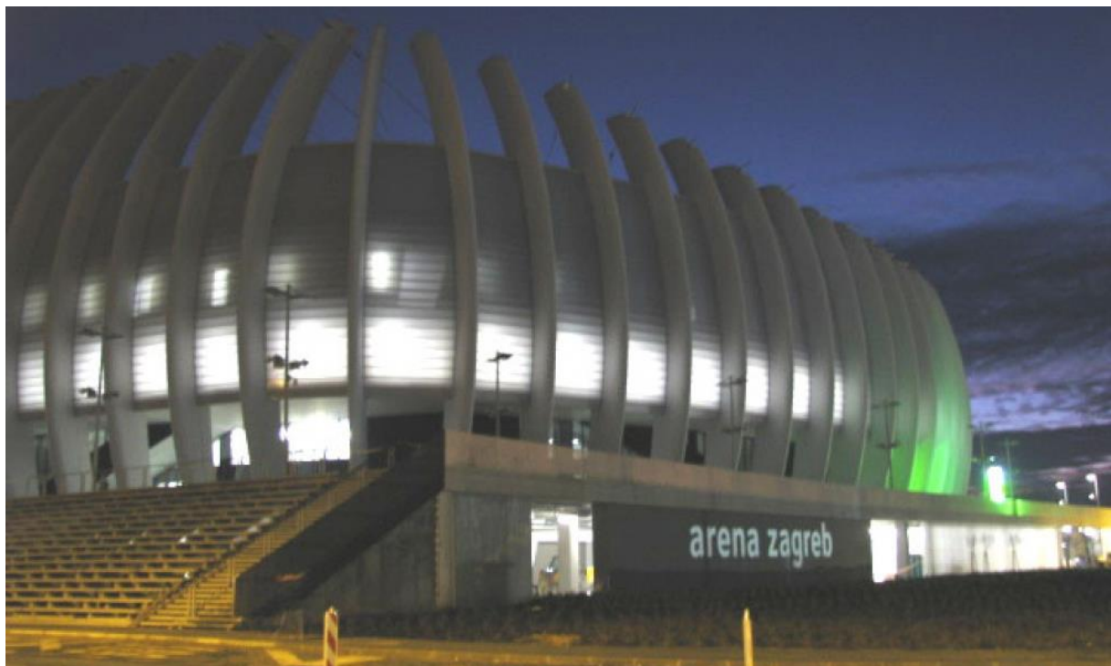
Slika 2. Arena Zagreb