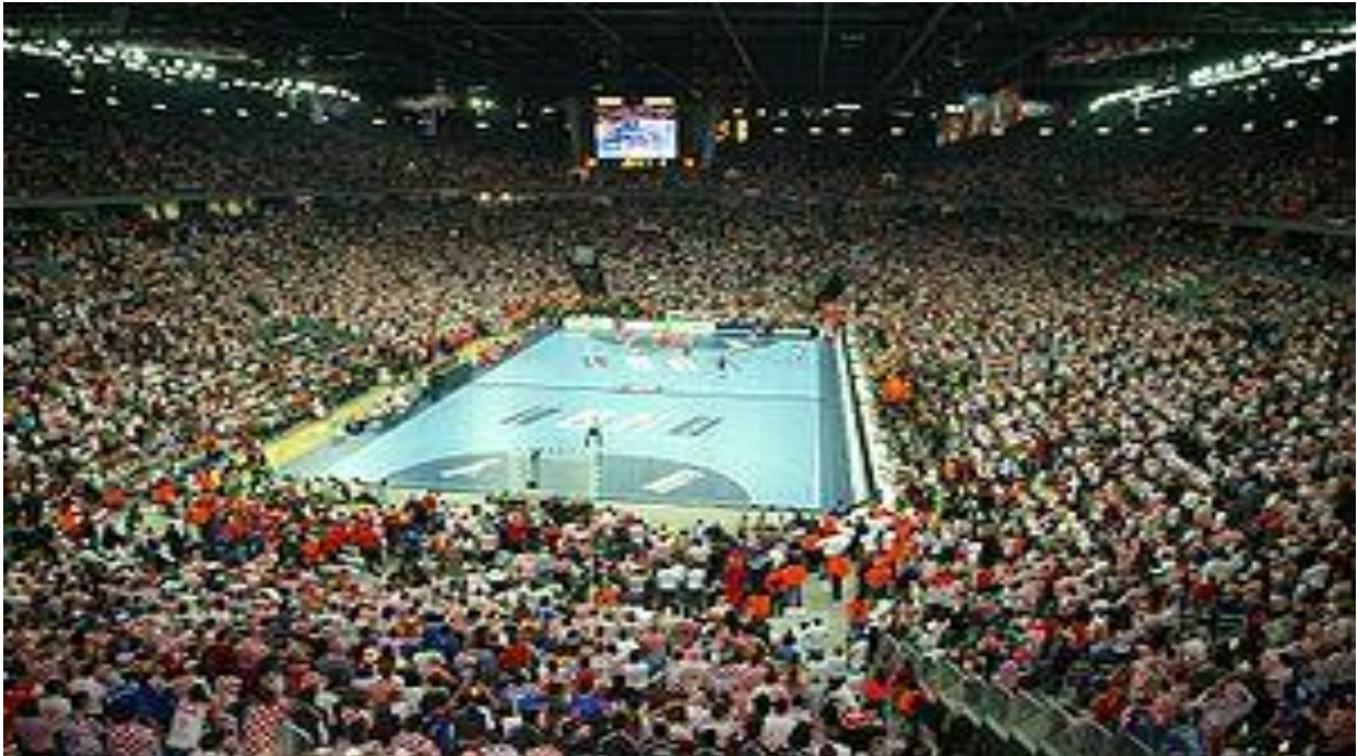
Slika 3. Arena Zagreb, Francuska-Hrvatska 22:19, 58:11 min