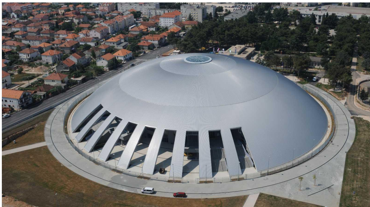
Slika 5. Dvorana Krešimira Čosića