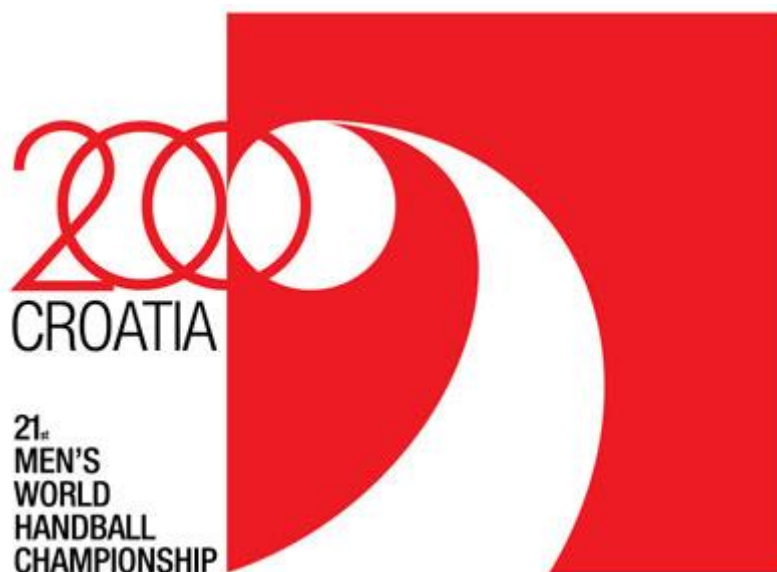
Slika 1. Logo prvenstva