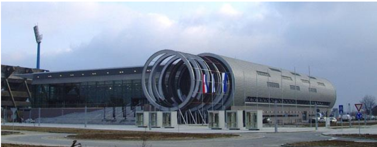
Slika 6. Sportska dvorana Gradski Vrt