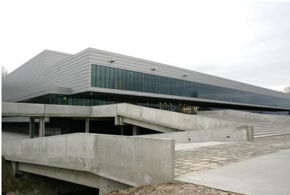
Slika 7. Sportska dvorana Varaždin