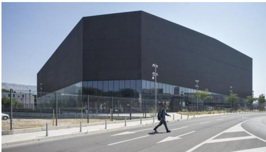
Slika. 4. Spaladium Arena