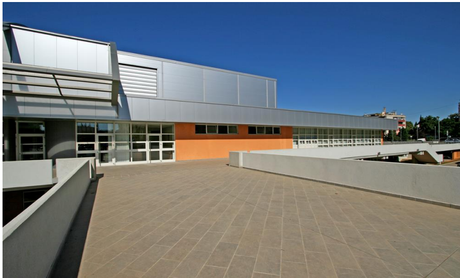
Slika 9. Dom sportova Mate Parlov