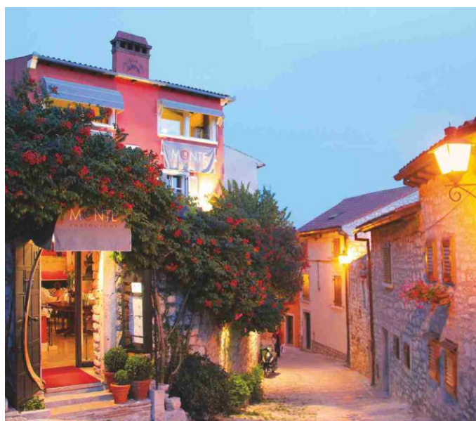
Slika 4. Restoran Monte.

Rovinjski restoran Monte potvrdio je 2018. godine Michelinovu zvjezdicu osvojenu lani, kada je jedini iz Hrvatske ušao u ovo elitno društvo. Ove godine pridružili su mu se još šibenski restoran Pelegrini i dubrovački 360o, također ovjenčani jednom Michelinovom zvjezdicom, na prestižnoj listi u koju su uvrštena 24 nova restorana u Hrvatskoj. Rezultat je to tajnog obilaska hrvatskih restorana profesionalnih Michelinovih inspektora, a novi vodič za Hrvatsku objavljen je na web stranicama ovog globalno najznačajnijeg vodiča za restorane 45 . Trud, strast, ustrajan rad i slijeđenje vlastitog puta donijeli su uspjeh: već godinama Monte je ime za fine dining. To je prepoznao i Gault Millau pa je chef Danijel Đekić proglašen najboljim hrvatskim chefom za 2017. po Gault Millau vodiču. Najveće priznanje pak stiglo je od Michelina: restoran Monte, prvi u Hrvatskoj dobio je Michelinovu zvjezdicu 46 .