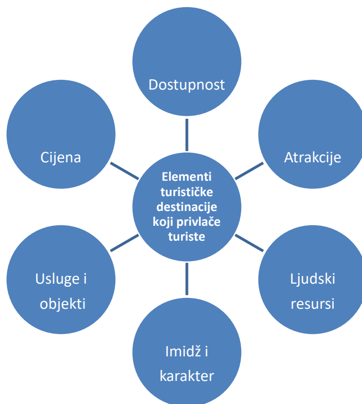
Slika 2. Elementi turističke destinacije koji privlače turiste.