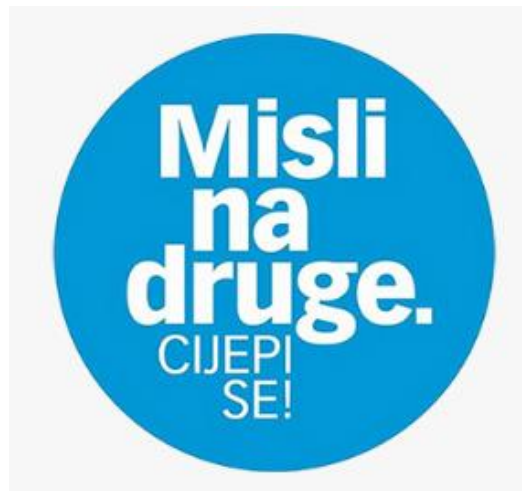
Slika 9. Logo kampanje cijepljenja protiv COVID-19