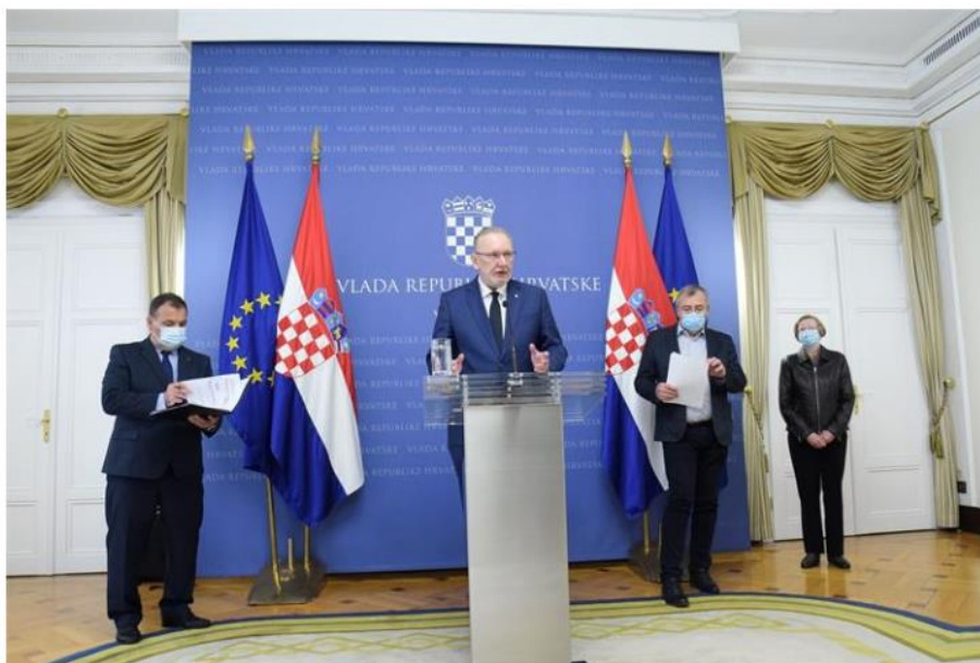
Slika 11. Članovi Stožera na konferenciji za medije 7. travnja 2022.