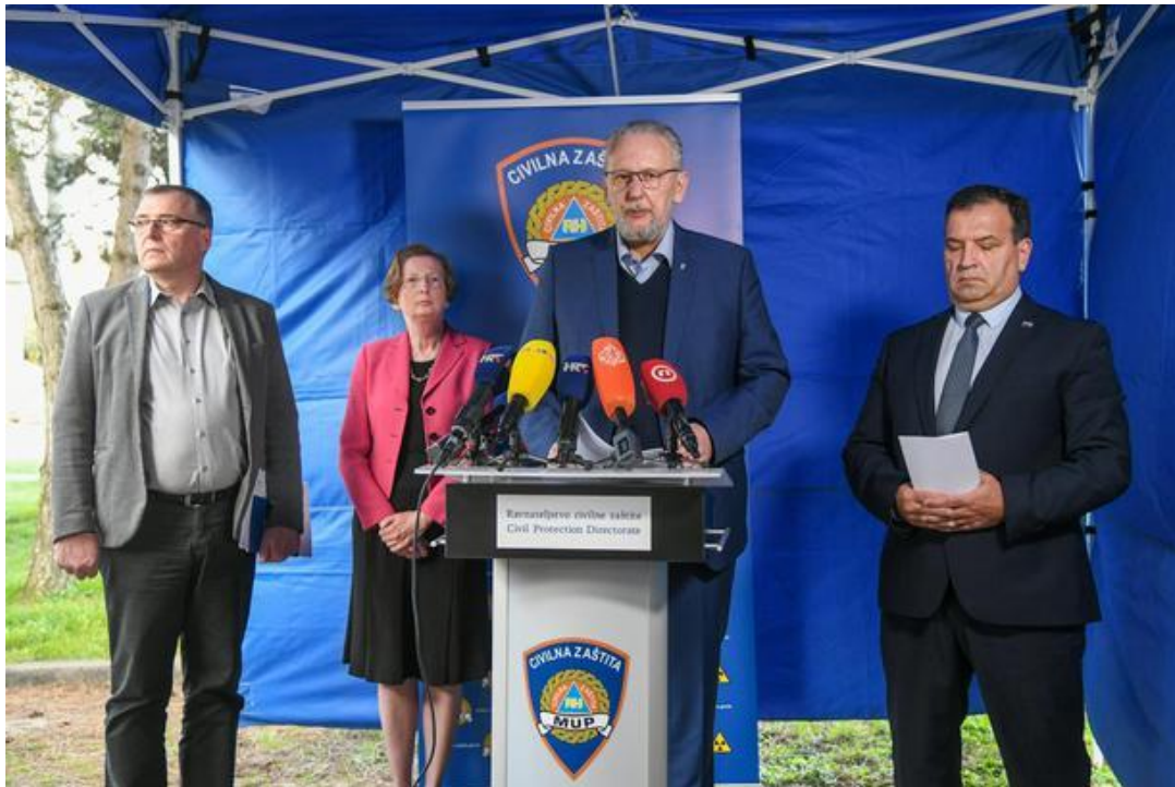
Slika 8. Članovi Nacionalnog kriznog stožera za vrijeme pandemije koronavirusa (slijeva nadesno: Capak, Markotić, Božinović, Beroš)