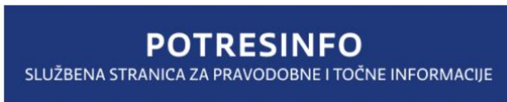
Slika 3. Baner stranice o potresu na stranici Stožera civilne zaštite

Izvor: Civilna zaštita Republike Hrvatske. URL: https://civilna-zastita.gov.hr/ (12.04.2022.)