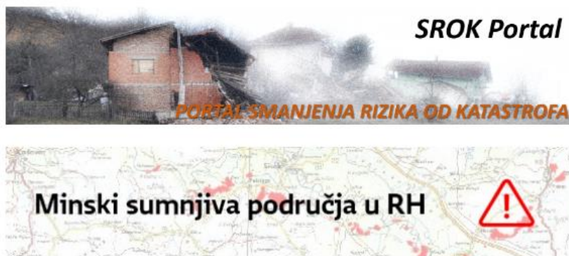
Slika 5. SROK portal i portal Minska sumnjiva područja u RH na stranicama Civilne zaštite