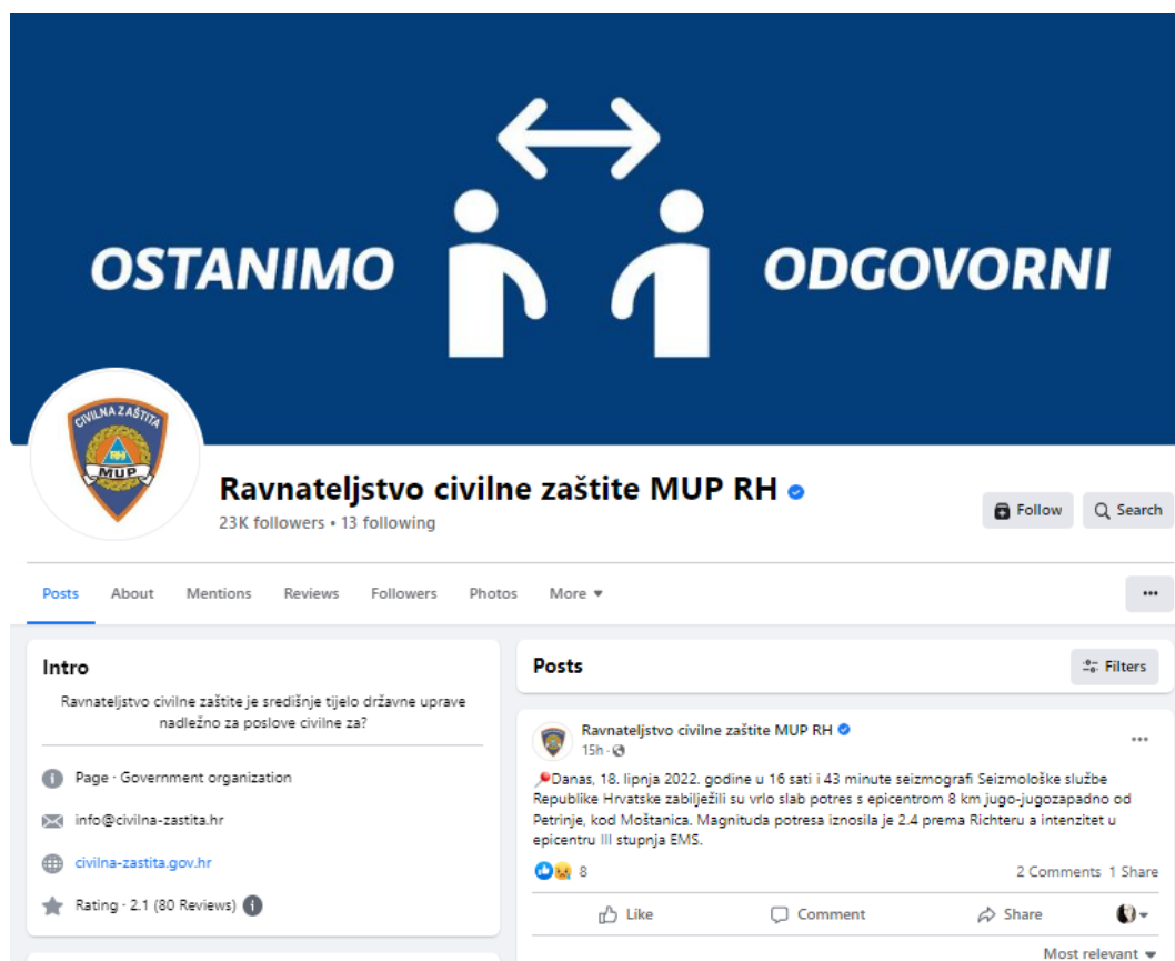
Slika 6. Facebook stranica Ravnateljstva civilne zaštite Republike Hrvatske