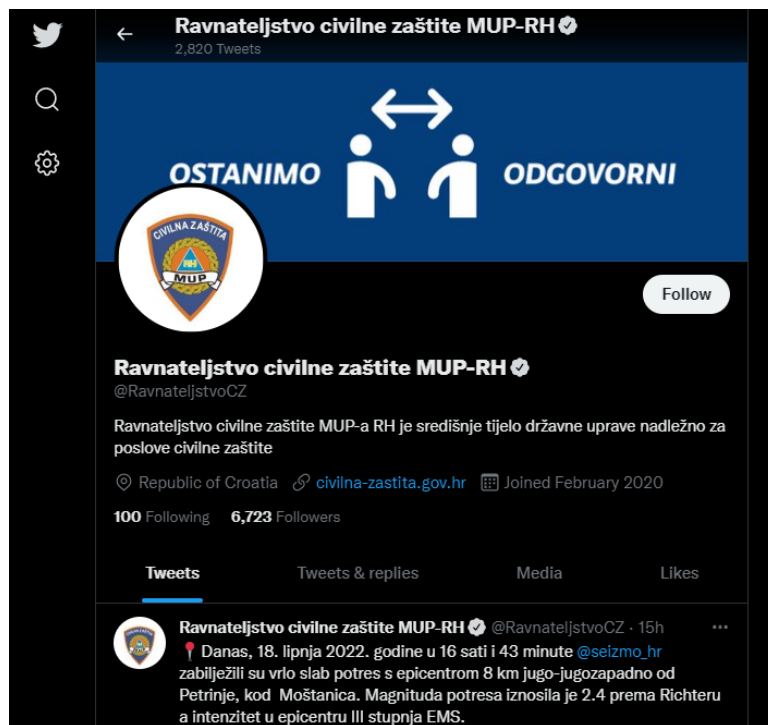
Slika 7. Twitter profil Civilne zaštite Republike Hrvatske