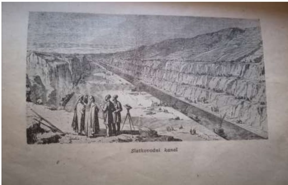
Slika 1. Slatkovodni kanal