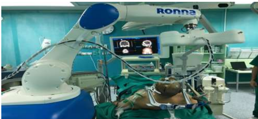
Slika 1. Robot Ronna na odjelu neurokirurgije u KBC Zagreb

Modularne medicinske mobilne platforme konstruirane su za oba robotska sustava te je sustav dobio prepoznatljiv izgled. Nakon raznih pretkliničkih pokusa dobivena je treća generacija Ronne robotskog sustava pomoću koje je 2016. godine izvedena prva robotska stereotaktička neurokirurška operacija, čime je započela faza kliničkih ispitivanja robotske platforme. To je prvi takav operacijski zahvat u ovom dijelu Europe (Jerbić i sur., 2020.).