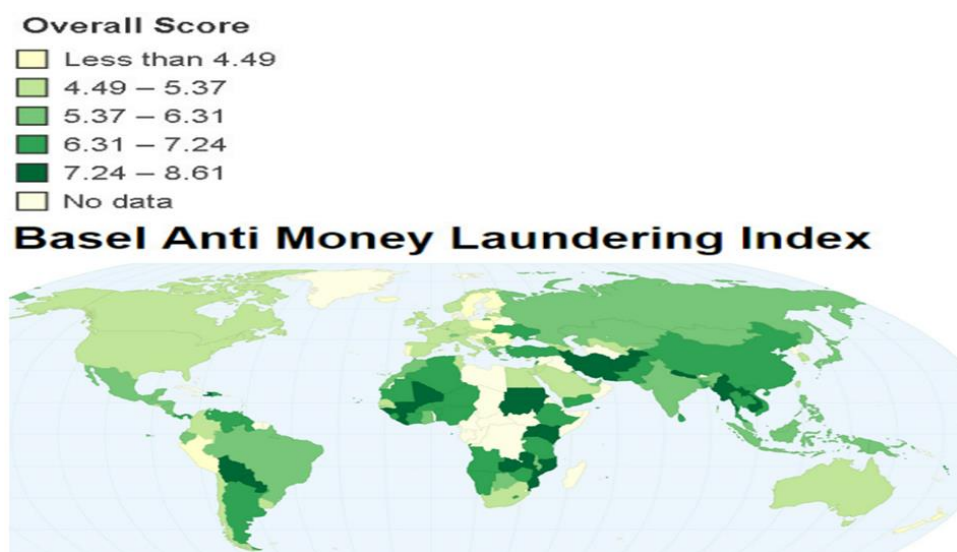
Slika 1. Index rizika