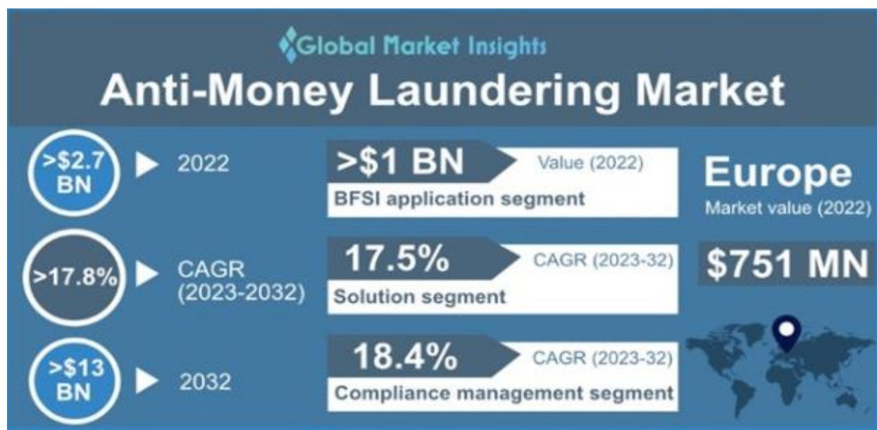
Slika 3. Prognoze tržišta