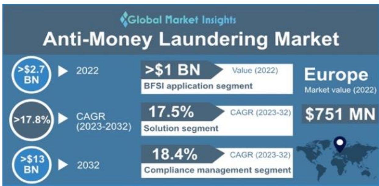
Slika 3. Prognoze tržišta