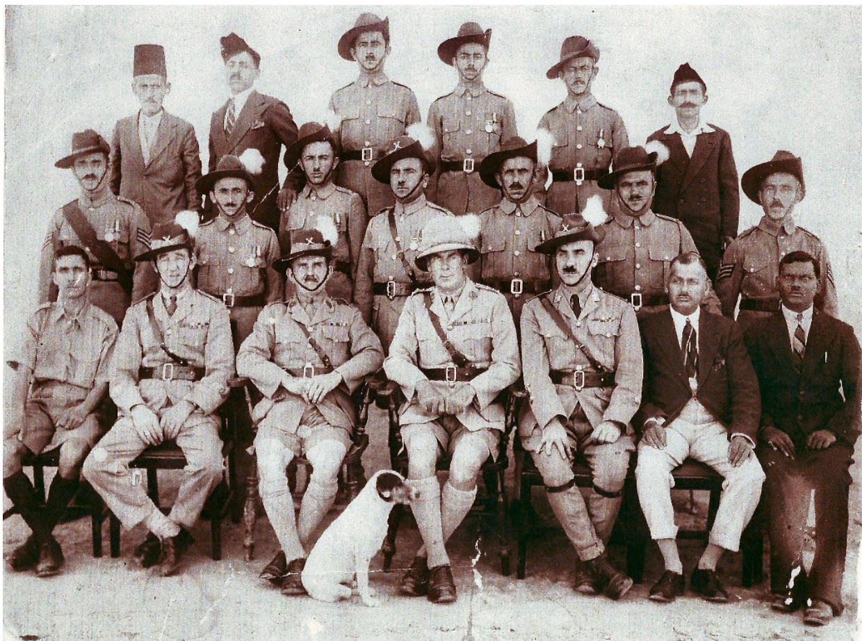
Slika 5. „Asirska vojna jedinica iz sredine 20. stoljeća“

snaga koje su bitna nadopuna zračnoj kontroli. Ne samo da je zračna kontrola u Iraku spasila ovu zemlju mnogo milijuna funti, ali služi kao model koji je proširen na nekoliko dijelova Carstva. Ono što se općenito ne cijeni je da su, nakon ozbiljnog razočaranja tijekom tog razdoblja, usluge Asiraca tijekom sadašnjeg rata premašile sve što su činili prije. Da nije bilo njihove lojalnosti u vrijeme Rashida Alijeve revolucije, inspirirane Nijemcima u Iraku u svibnju 1941., naš položaj na Bliskom istoku postao bi vrlo neizvjestan.” (Nineveh, 1995)