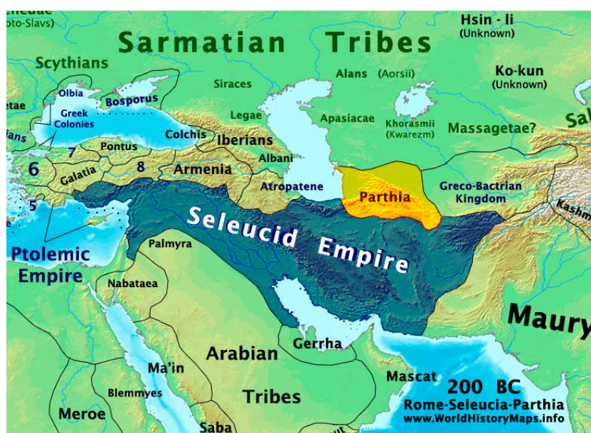
Slika 2. „Prikaz granica Seleukidskog i Partskog carstva“

Krajem 4. stoljeća prije Krista, po izlasku iz Egipta, Aleksandar Veliki uputio se prema sjeveru Mezopotamije gdje se, u bitci kod Gaugamela, sukobio s Dariom III. Tom prilikom osvojio je i Babilon te proširio helenski utjecaj na Mezopotamiju (Arrian, 1971). Nakon njegove smrti Makedonsko Carstvo na tom području zamijenila je vladavina Seleukida. Grčka vladavina na Istoku nije dugo trajala, satrapi su se počeli buniti protiv Seleukidskog Carstva u Iranu i Baktriji, uspostavljajući vlastita područja. Pošto su grčke vlasti bile okupljene stalnim iranskim napadima, Asirci su preuzeli ulogu pogranične pokrajine braneći Seleukidsko Carstvo od Parata (Slika 2).