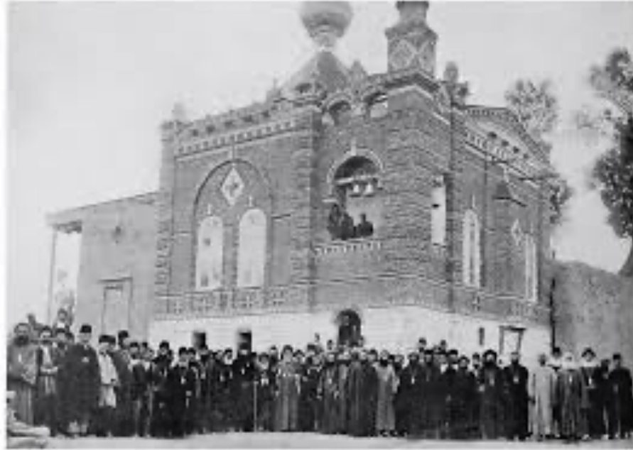
Slika 3. „Crkva sv. Marije u ranom 20. stoljeću“