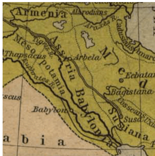
Slika 1. „Zemljopisni prikaz perzijske satrapije Athura“

Za vrijeme Ahmenidskog Perzijskog Carstva koje je trajalo od 6. st. pr. Kr. do sredine 4. st. pr. Kr., Asirci se javljaju u sklopu satrapije 2 Athura (Slika 1).