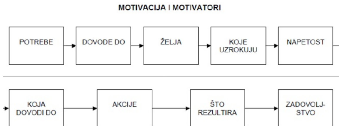
Slika 2. Motivacija

Motivacija nam stvara žudnju za nekim rezultatom ili ciljem, a zadovoljstvo je posljedica tog rezultata.