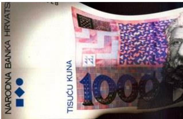
Slika 3. Prikaz plaće kao faktor motivacije

Prema teoriji hijerarhijskih potreba Abrahama Maslowa, svaki čovjek nastoji zadovoljiti pet osnovnih potreba - fiziološke, potrebe za ljubavlju i sigurnošću, socijalne potrebe, potrebe za poštovanjem i moći, te potrebe za samoispunjenjem. Ako ih povežemo s poslom, samo se prva od njih direktno veže uz novac, ostale su psihološke. Dobar menadžer će prepoznati kod kojih je zaposlenika neka od ovih potreba izraženija i na temelju toga upotrijebiti motivacijske tehnike. Primjerice, ako je kod zaposlenika izražena potreba za poštovanjem, menadžer će ga pohvaliti kad učini nešto dobro ili mu pomoći u slučaju pogreške. Pred takvim osobama uspjeh grupe menadžer ne bih smio pripisivati samo sebi, jer će tako izazvati kontraefekt. S druge pak strane, zaposlenici koji teže ka samoispunjenju, vjeruju u svoj rad i njih se ne može pridobiti nagradama niti laskanjem. To su obično visoko stručne osobe koje su spremne na sebe preuzeti odgovornost. Kako bi zadržali takvog zaposlenika, menadžeri trebaju razgovarati s njim kao sa sebi ravnom osobom i ocjenjivati njegov rad potpuno realno. Jasno je da je za zaposlenike s izraženim potrebama za poštovanjem i samoispunjenjem prikladan demokratski tip rukovođenja. Takav tip rukovođenja neće biti jednako uspješan za zaposlenike koji se osjećaju nesigurni i uz to su nemotivirani. Njima ćete u početku morati davati zadatke u strogo određenim okvirima, inzistirati na poboljšanju, te im