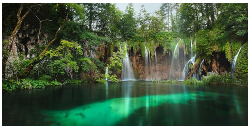
Slika 6: Nacionalni park Plitvička jezera