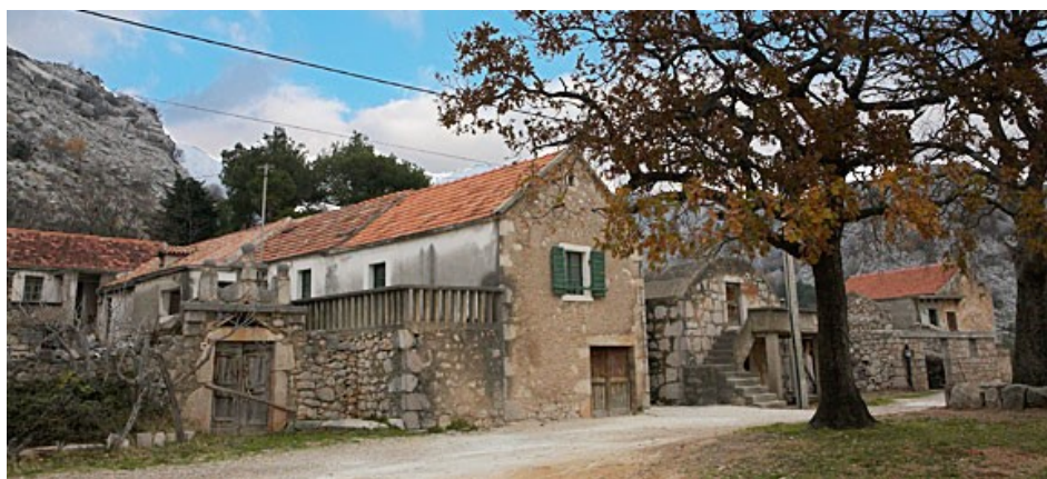
Slika 11: zaseok Marasovići, etno kuća