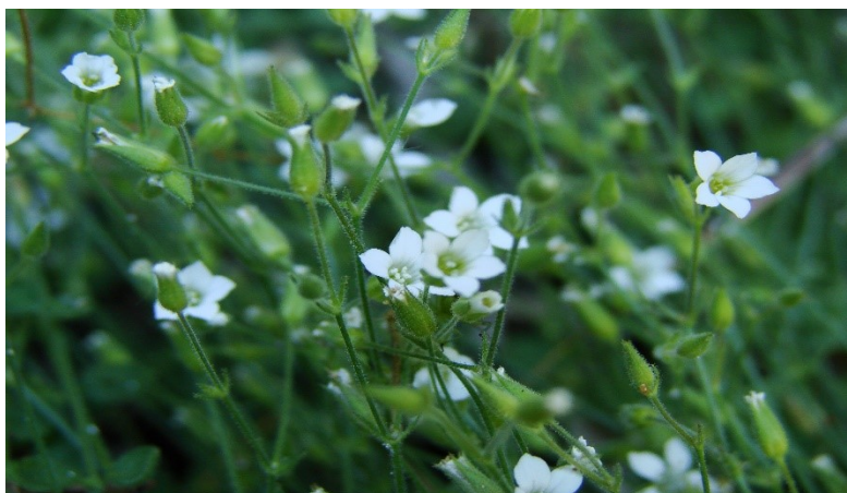
Slika 10: okruglolisna pjeskarica (Arenaria orbicularis)