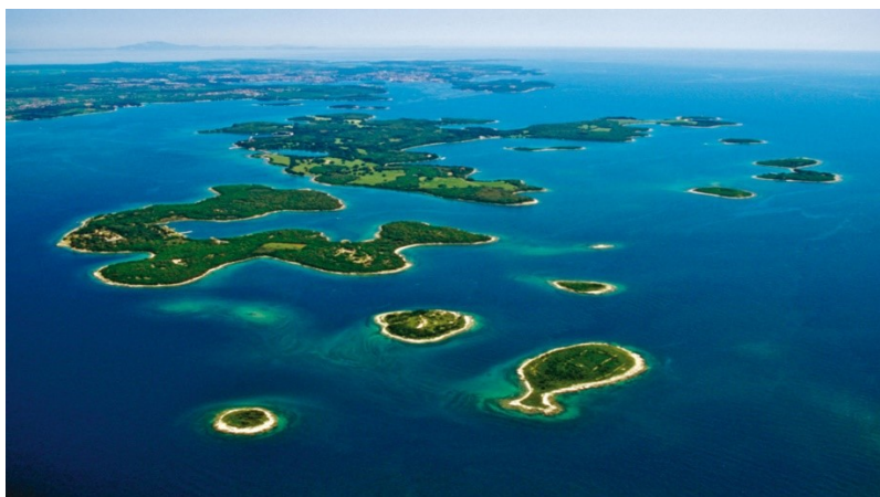
Slika 8: Nacionalni park Brijuni