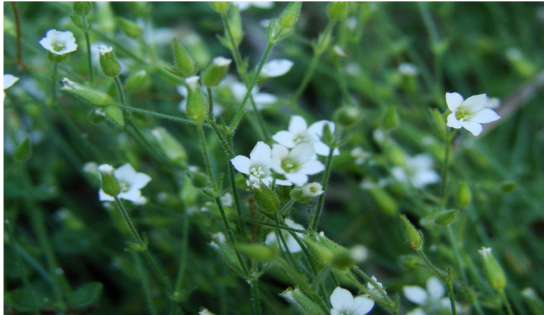
Slika 10: okruglolisna pjeskarica (Arenaria orbicularis)