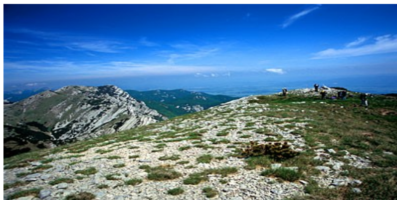
Slika 9: Vaganski vrh (1757m), najviši vrh Velebita

Izvor: http://www.np-paklenica.hr/index.php/park/prirodna-bastina/reljefno-geoloske-osobitosti (preuzeto 31.7.2018)