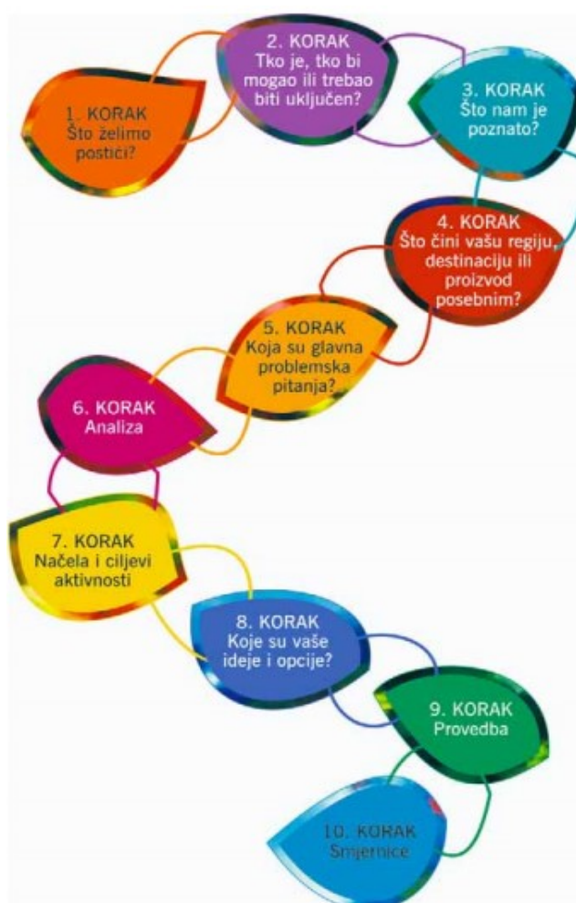
Slika 5: 10 koraka održivog turizma