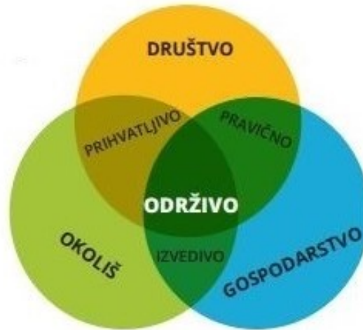
Slika 3: Dimenzije održivog razvoja