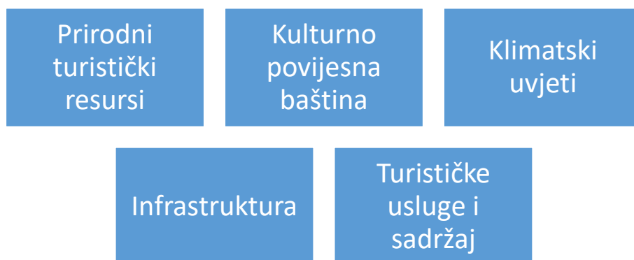
Slika 1: Podjela turističkih resursa (WTO)

Prema Svjetskoj turističkoj organizaciji turističke resurse dijelimo na :