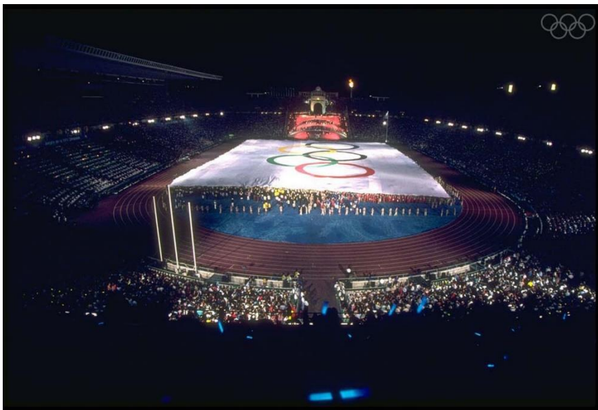
Slika 3 Otvaranje olimpijskih igara u Barceloni 1992. godine