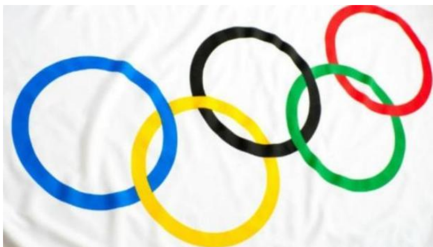
Slika 1 Službeni simbol olimpijskih igara - olimpijski krugovi

Izvor: www.olympic.org (10. prosinca 2016.)