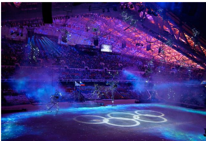
Slika 4 Otvaranje zimskih olimpijskih igara u Sočiju 2014. godine