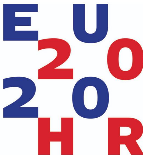
Slika 2. „Tipografska šahovnica“-vizualni identitet predsjedanja Republike Hrvatske Vijećem EU