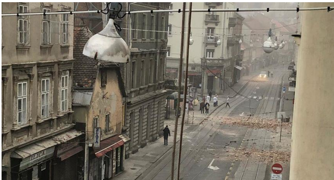
Slika 5. Prizor centra Zagreba pogođenog razornim potresom u jeku predsjedanja, 22.ožujka 2020.