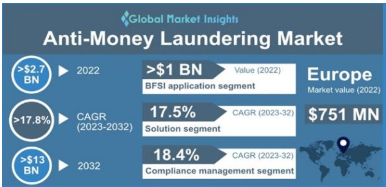
Slika 3. Prognoze tržišta