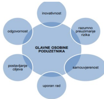
Slika 1.: Glavne osobine poduzetnika

Izvor: Rajsman, M., Petričević, N. i Marjanović, V. (2013): Razvoj malog gospodarstva u Republici Hrvatskoj, Ekonomski vjesnik, 26. (Pristupljeno 26.3.2023.)