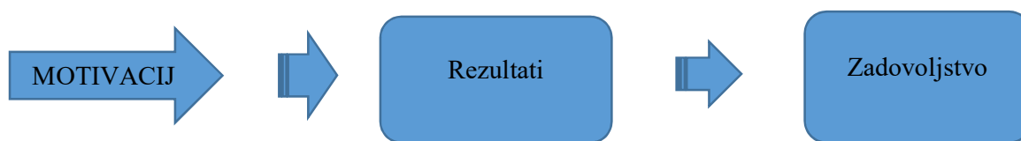
Slika 4. Odnos motivacije i zadovoljstva