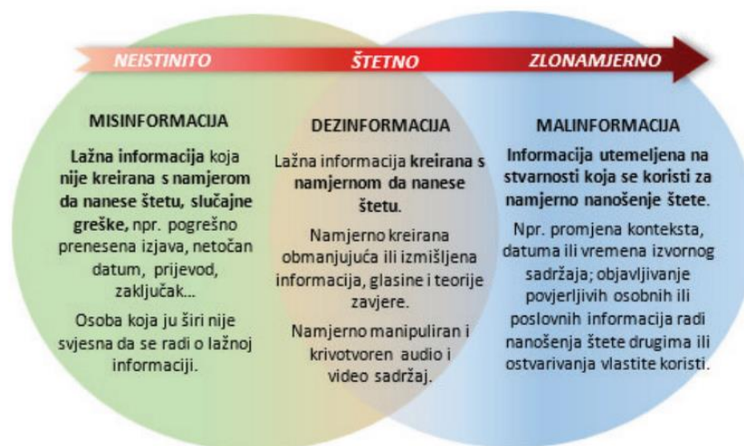
Slika 2. Vrste informacijskih poremećaja i njihov odnos