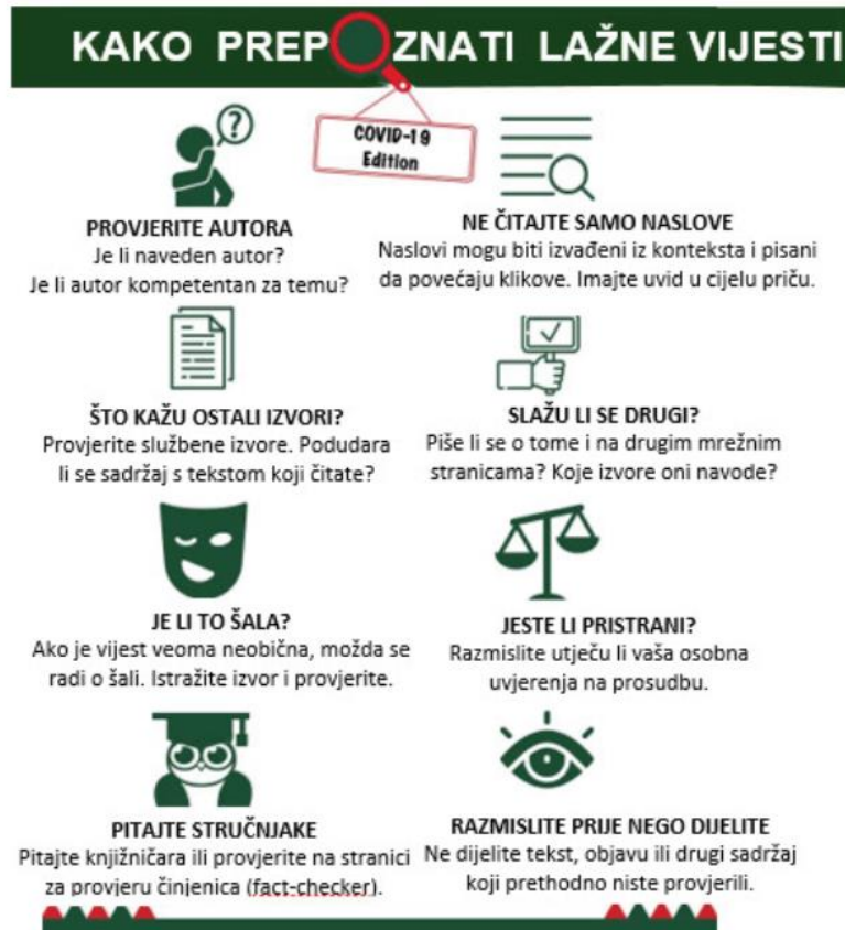
Slika 3. Smjernice za prepoznavanje lažnih vijesti o bolesti COVID-19