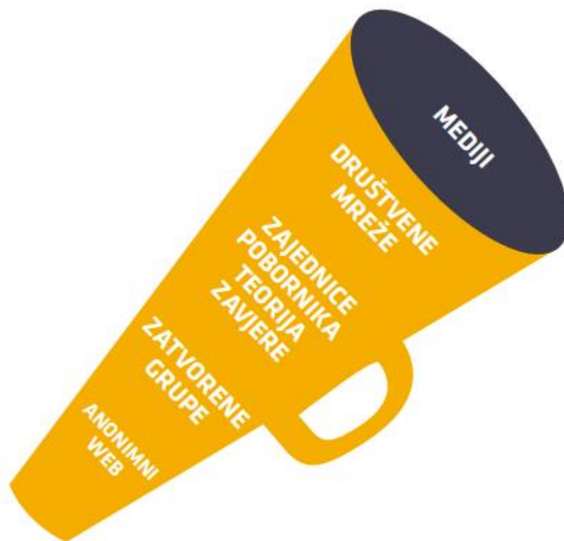
Slika 1. Truba širenja dezinformacija

političara) s društvenih mreža. Truba širenja dezinformacija (Slika 1) na slikovit način pokazuje kako manipulacije uglavnom kreću od manjih marginalnih skupina koje ih najprije dijele u svojim zatvorenim grupama ili u zajednicama pobornika teorija zavjere. Prvi veliki uspjeh dezinformacije i njihovi kreatori ostvaruju kada se počnu širiti društvenim mrežama, a pogotovo ako uspješno prelaze s platforme na platformu. Glavni cilj ostvaruju ako ih preuzmu i objave klasični mediji koji im time daju kisik, legitimitet i prezentiraju ih širokoj populaciji. Jako je teško pobijati neistine i manipulacije nakon što su ih objavili klasični mediji (Chiou, Tucker, 2018).