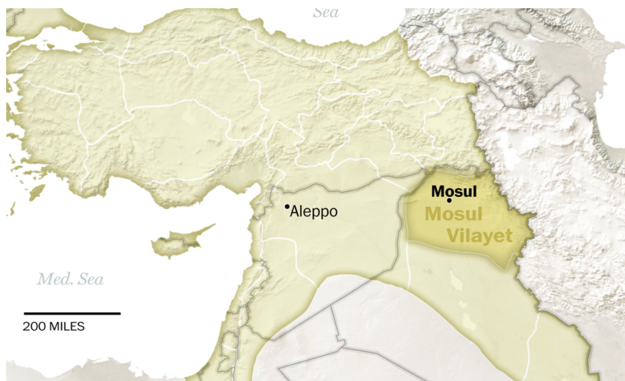
Slika 4. „Mosulski vilajet“

Početakom 1921. je održana konferencija u Kairu, u Egiptu, i Britanska vlada odlučila se za formiranje budućih asirskih jedinica. Plan je bio da asirske jedinice zamijene britanske i indijske trupe u Iraku, preuzmu stražu u okrugu Mosula i Kurdistanu i popune prazninu dok se iračka nacionalna vojska ne osposobi za poduzimanje tih dužnosti. Britanski časnici poput kapetana MacNarnyja i kapetana Rentona krenuli su u intenzivnu kampanju uvjeravanja Asiraca da im se pridruže. Asirske snage od 6000 vojnika, zajedno s asirskim časnicima, stavljene su pod zapovjedništvo Kraljevskih zračnih snaga i njima je zapovijedao pukovnik H. T. Dobbins. Asirske postrojbe su korištene protiv turske vojske i Kurda koji su se pobunili protiv Britanaca na području Mosulskog vilajeta (Slika 4).