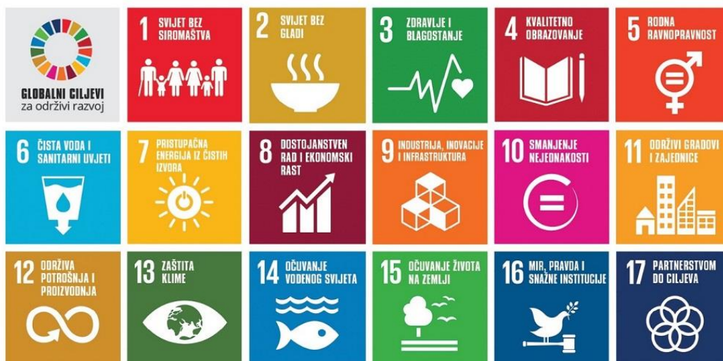
Slika 3. 17 ciljeva održivog razvoja 14

Nešto širi opis pojedinih ciljeva objavljen je u dokumentu Opće skupštine Ujedinjenih naroda kako slijedi: