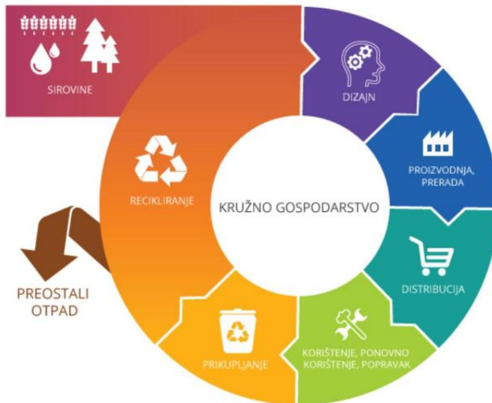
Slika 2. Kružno gospodarstvo 12

odnose na globalnu konkurentnost, održivi gospodarski rast te stvaranje novih radnih mjesta 11 u državama članicama Europske unije, što se dakle odnosi i na Republiku Hrvatsku. Faze kružnog gospodarstva i redosljed kojim se one odvijaju prikazani su na sljedećoj slici: