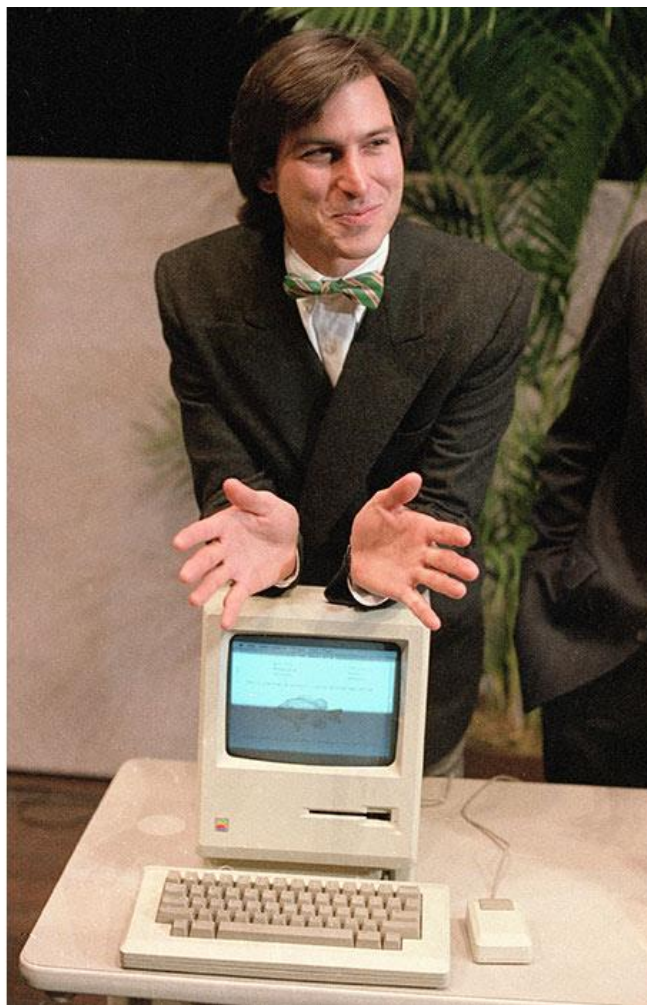
Slika 2. Steve Jobs 1984. na predstavljanju Macintosh kompjutera u Kaliforniji